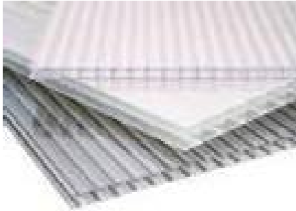
LASTRA ALVEOLARE cm. Largh.210 Lungh. 300-600 SPESSORE mm. 4 – 6 – 8 – 10 – 16 COLORE neutro – A richiesta bronzo - fume - bianco