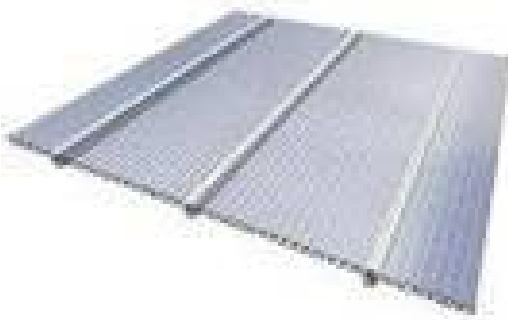
LASTRA ALVEOLARE GREGATA LARGH. Cm 400-500-600 COLORE NEUTRO