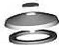
RONDELLONE mm. 6-8-10-16