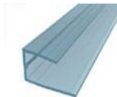
TAPPO U cm. Lungh. 600 sp. mm 6-10-16